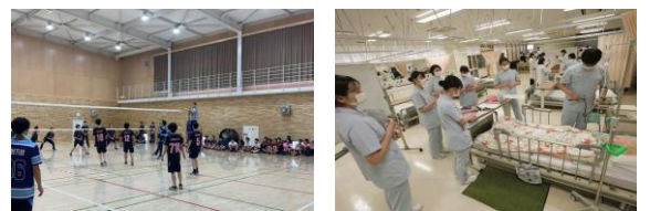
碧鷗館（第二屋内運動場）