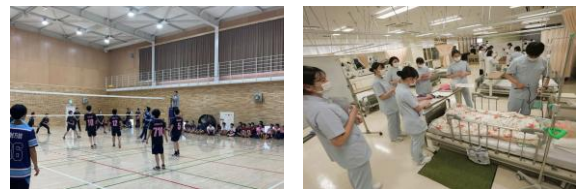
碧鷗館（第二屋内運動場）