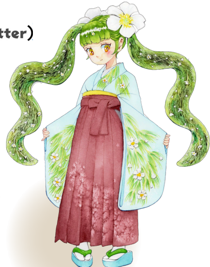
白石梅花藻姫 絵師：うりゃん！さん